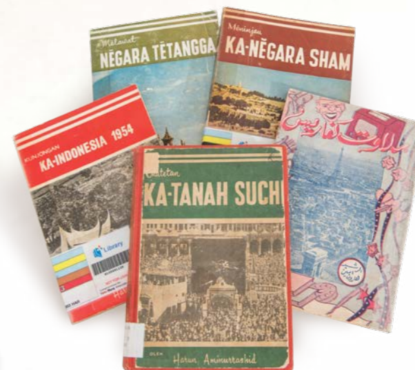
(Clockwise from top left) Melawat Negara Tetangga , Meninjau Ka-Negara Sham , Melawat Ka-Paris , Chatetan Ka-Tanah Suchi and Kunjongan Ka-Indonesia 1954 were all written by Harun Aminurrashid.