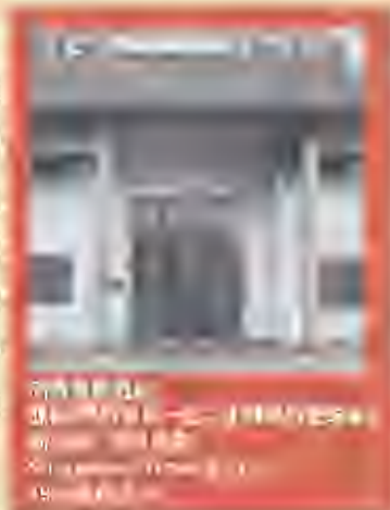
1857年, 同济医院在新加坡, 它是新加坡历史最早的中医院, 也是新加坡中医药历史的见证。

早期中医师行医比较集中的地点是免费施医赠药、扶弱济贫的慈善机构, 最有代表性的是创立于1857年的同济医院, 它是新加坡历史最早的中医院, 也是新加坡中医药历史的见证。