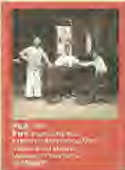
1610年, 郑和船队在新加坡, 展示了中草药贸易在东南亚有着悠久的历史。

根据史书记载, 新加坡早在莱佛士登陆之前已是一个商船往来的港口, 明代郑和下西洋时也从东南亚带回乳香、没药、血竭、使香、丁香、胡椒等药材, 显示了中草药贸易在东南亚有着悠久的历史。 4