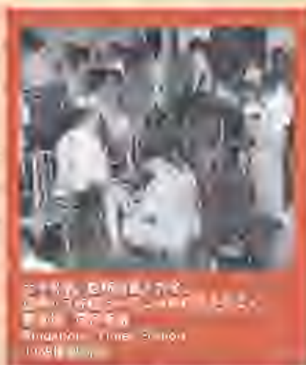
1946年, 新加坡中医师公会成立, 推动了新加坡中医药事业的发展。

由于政治经济、历史与地理环境的关系, 殖民时代、日治时期, 到新加坡的独立建国, 新加坡始终以西方的文化为生流, 医疗卫生主要是西医和西药, 中医药则处于主流医疗机构之外,