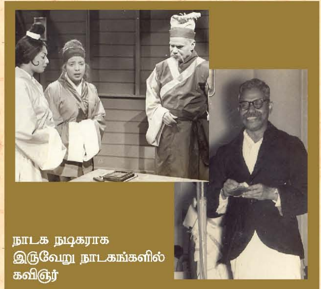
நாடக நடிகராக இருவேறு நாடகங்களில் கவிஞர்

1935 விருந்து 1960 வரை ந. பழநிவேலு அவர்கள்