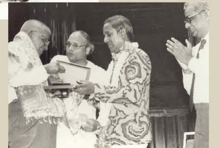
சிங்கப்பூர் இந்திய நுண்கலைக் கழகத்தின் 'கலாரத்னா' விருது பெறுகிறார் கவிஞர்