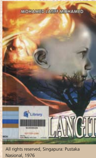
All rights reserved, Singapura: Pustaka Nasional, 1976

Peristiwa perpisahan di antara Singapura dan Malaysia ini telah "dihidupkan" lagi baru-baru ini apabila Encik Lee Kuan Yew, Menteri Pembimbing Singapura mencetuskan tentang kemungkinan Singapura bergabung dengan Malaysia kembali seperti yang telah disiarkan oleh akhbar-akhbar utama seperti The Straits Times terbitan Singapura dan New Straits Times terbitan Malaysia. Sebagai satu proses yang aktif, ia membangkitkan kembali peristiwa yang telah berlaku 42 tahun yang lampau. Tetapi kini sudah tentu kita boleh merenung kembali peristiwa perpisahan itu dengan pandangan dan harapan yang berbeza.