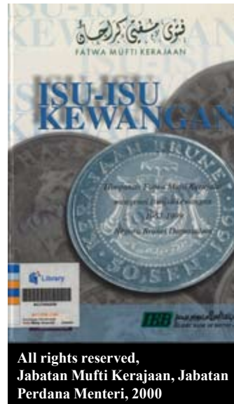
All rights reserved, Jabatan Mufti Kerajaan, Jabatan Perdana Menteri, 2000

Sistem ekonomi syariah sangat jauh berbeza dengan ekonomi kapitalis sosialis mahupun komunis. Namun, masih ramai yang masih belum dapat memahami sepenuhnya diantara produk dan perkhidmatan Perbankan Islam dengan Perbankan konvensional. Hal ini disentuh di dalam buku “Wang, Anda dan Islam” (2008), yang memberikan perincian yang jelas tentang ciri-ciri yang membezakan kedua sistem perbankan itu.