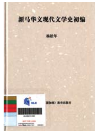
版权所有：新加坡：BPL教育出版社，2000。