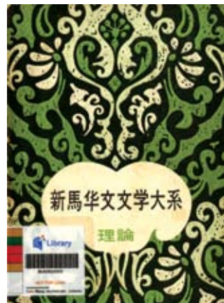
版权所有：新加坡：教育出版社，1971。