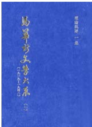
版权所有：香港：世界出版社，2000。