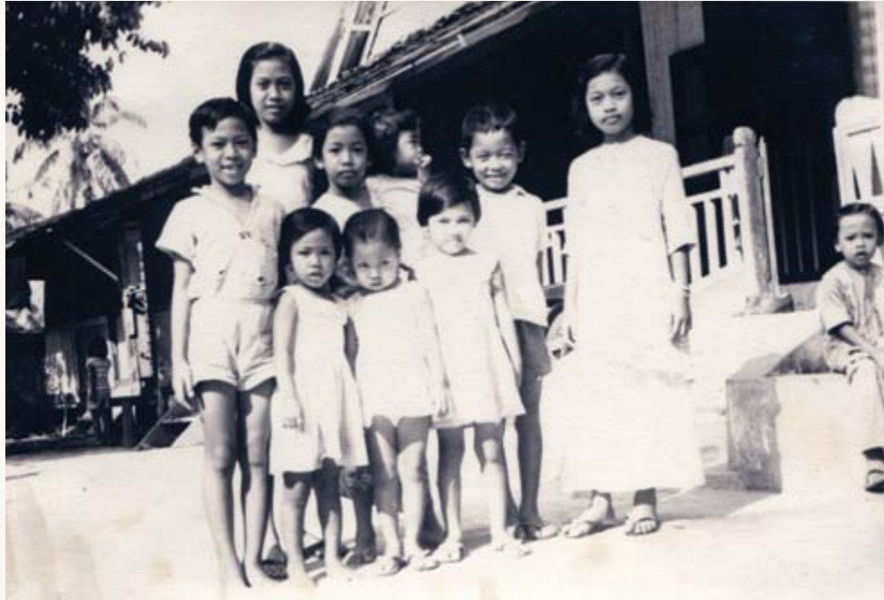
Anak-anak Kampung Pasiran di awal tahun 1960an.