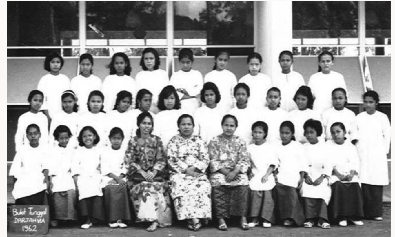
Penuntut-penuntut Darjah 6A bersama guru-guru Sekolah Perempuan Melayu Bukit Tunggul (1962).

Pastinya, Kampung Pasiran dan Bukit Tunggul kekal mewarnai sejarah masyarakat Melayu di Singapura dan kenangan kehidupan