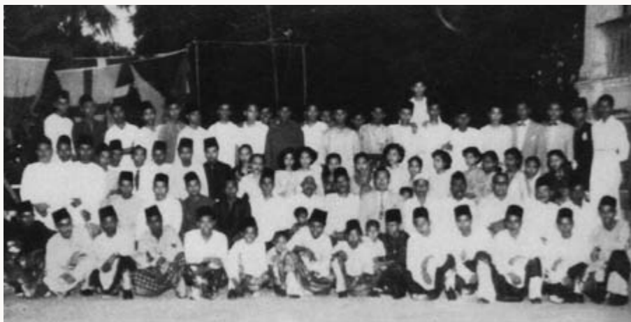
Penduduk Kampung Pasiran (1960an).