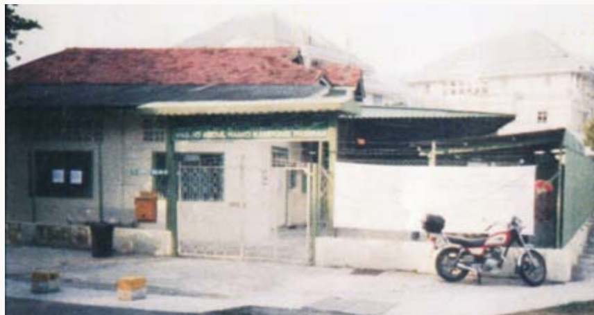
Masjid Kampung Pasiran (1961- 2001).

mempertingkatkan taraf hidup telah mencekutkan idea penubuhan Syarikat Kampung Pasiran pada 3 Disember 1946, syarikat kooperatif jimat cermat melalui simpanan tetap dari gaji ahlinya setiap bulan. Selain dapat berbangga dengan kejayaan syarikat ini meningkatkan taraf ekonomi ahlinya, ia juga merupakan di antara kooperatif kampung yang masih aktif hingga sekarang. 9