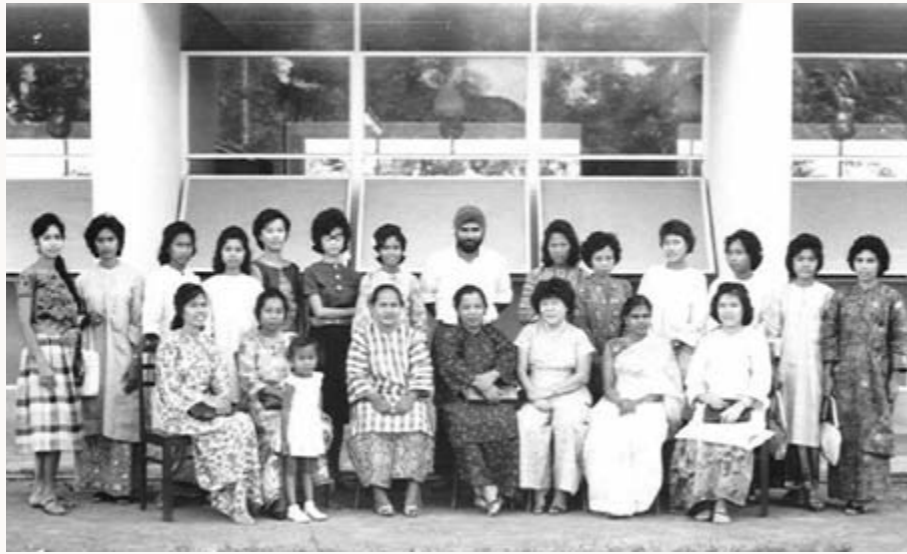
Guru-guru dan pekerja-perkerja Sekolah Perempuan Melayu Bukit Tunggul (1961).

dan Pameran Seni Lukis dan Kerja Tangan.